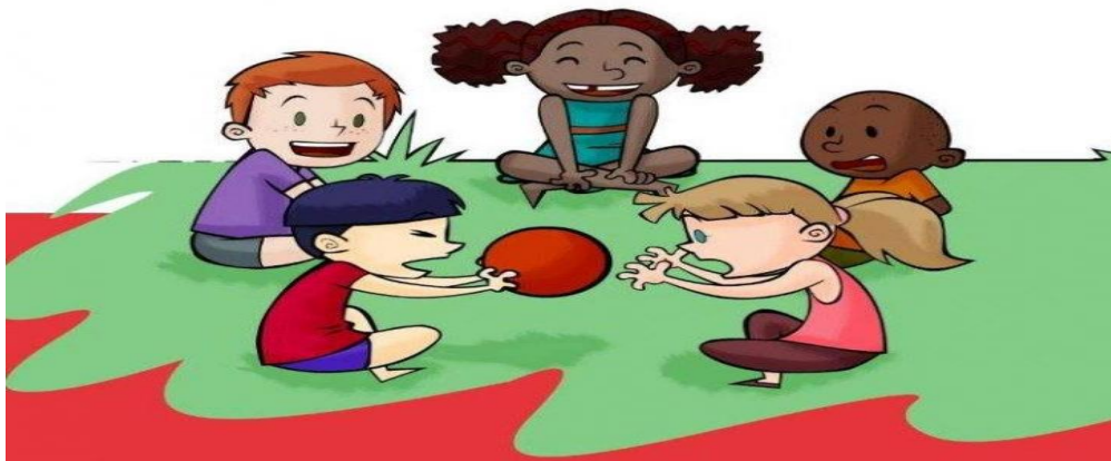
EXEMPLO DA ATIVIDADE DE PASSAR A BOLA.