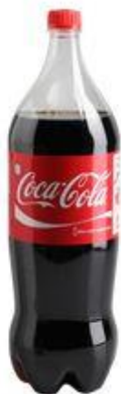
GARRAFA DE 2 LITROS